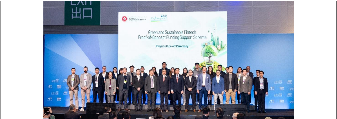
綠色和可持續金融科技概念驗證測試資助計劃的啟動禮在亞洲金融論壇上舉行。